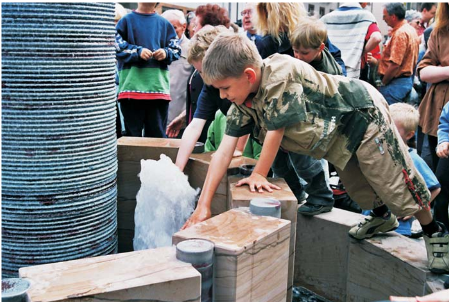
Einweihung Marktplatzbrunnen Nierstein am Rhein 2003