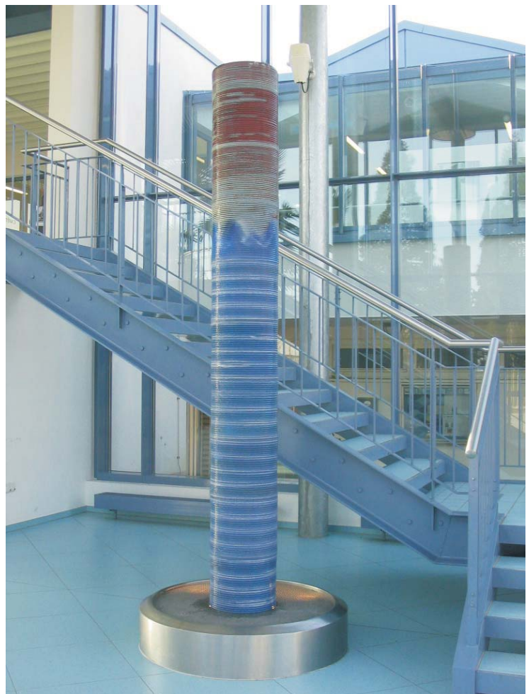
Wassersäule im Rheinhessen Bad Nieder-Olm, 2005