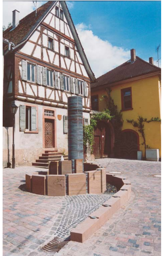
Marktplatzbrunnen in Nierstein am Rhein Ein erleb- und begehbare Brunnen Steinzeug bei 1260° C dichtgebrannt und frostbeständig, Buntsandstein Maße: Höhe 3 Meter, Ø: 5 Meter