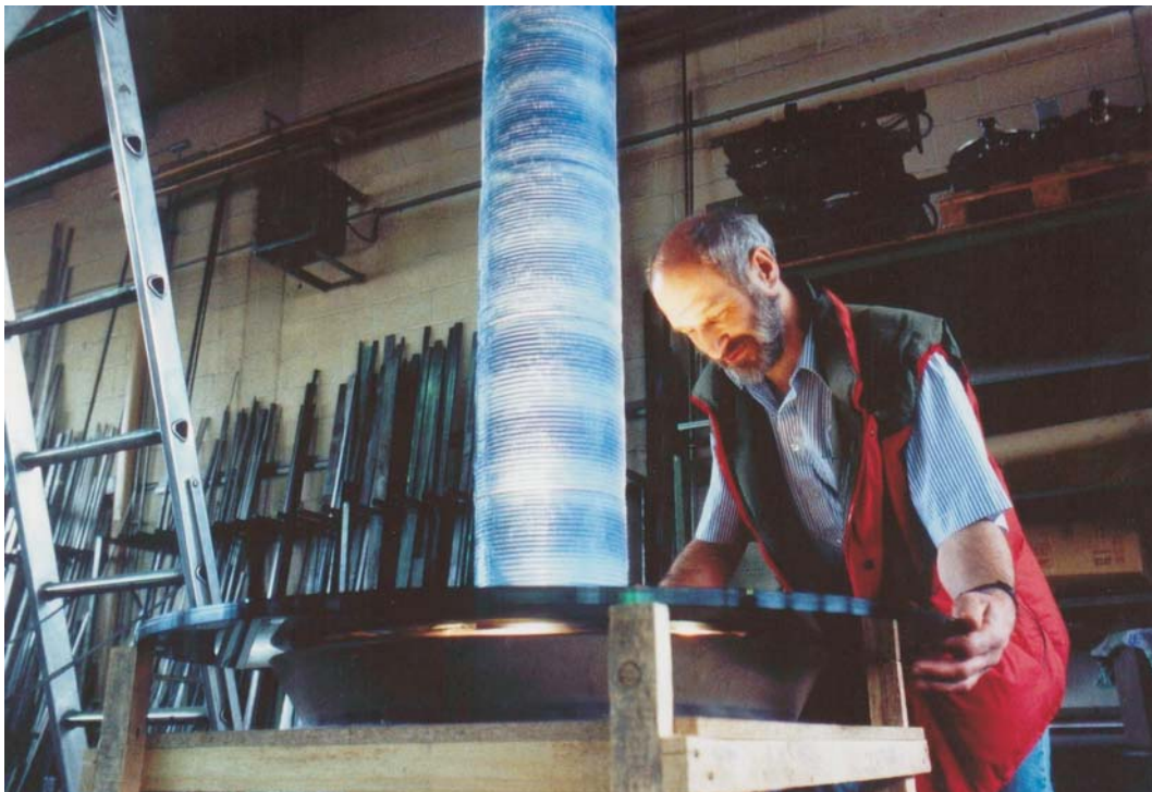
004 "Pendulum alpha" Expo 2000, hängendes Wasserobjekt

Dabei setze ich mit abstrakter Symbolik die speziellen Anforderungen des Projektes um und integriere es in die Umgebung.