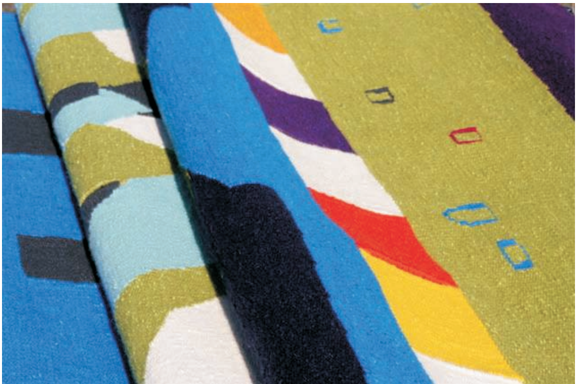
“Geballte Kunst” Detailansicht verschiedener Teppiche