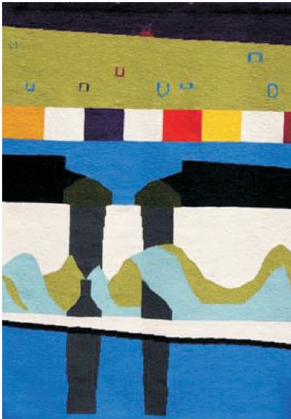
"grand steps" -2006 1,65 x 1,21m