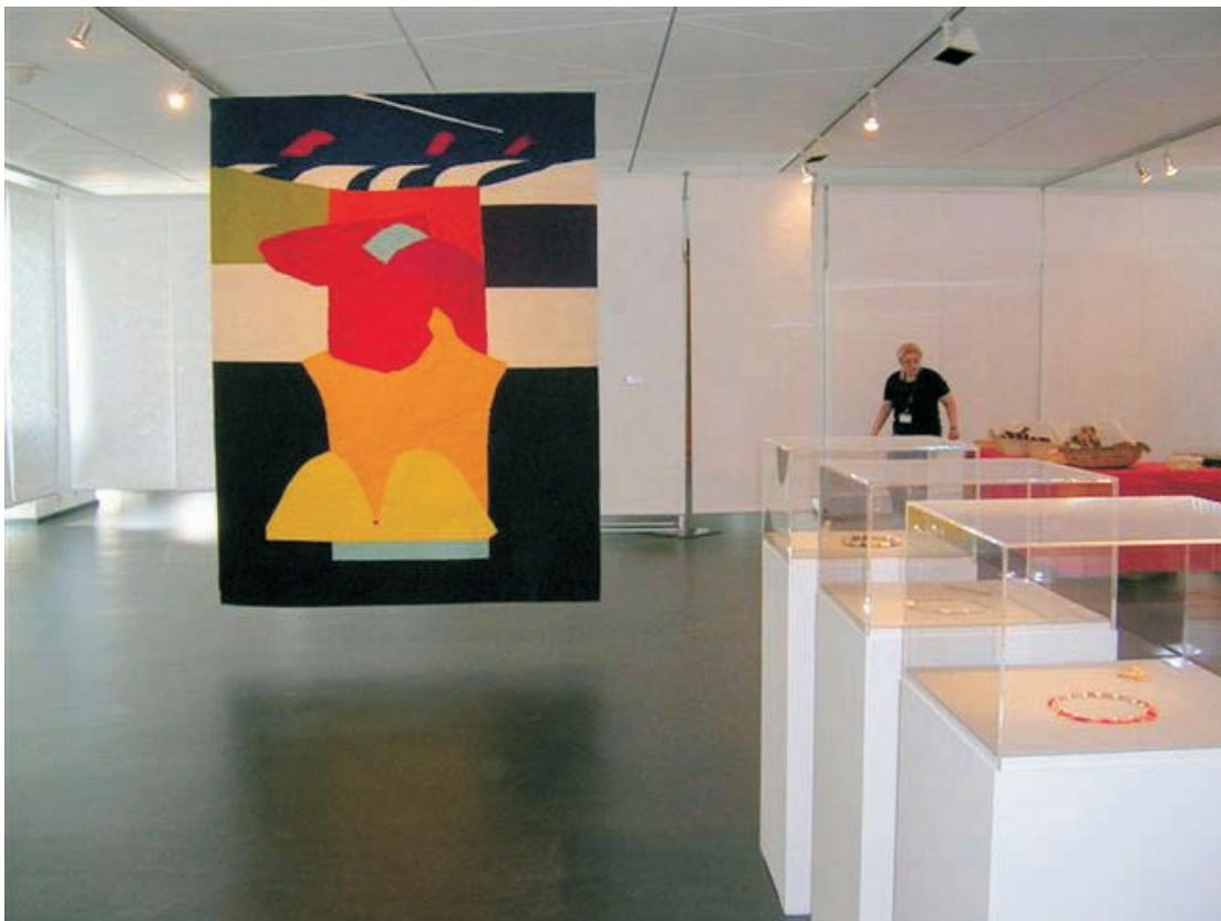
"heavens"- 2,85x2,00 m, Karlsruhe 2007 60 Jahre Bund d. Kunsthandwerker Baden-Württemberg

Deutsches Farbenzentrum mit Sitz in Weimar European Textile Network Deutsche Gesellschaft für Christliche Kunst Verband bildender Künstler GEDOK Heidelberg und Freiburg Intern. Bodenseeclub Überlingen- bild. Kunst