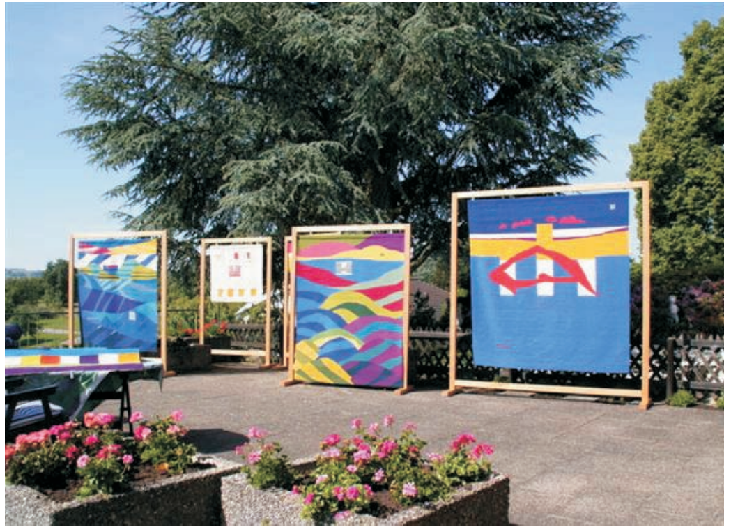
Atelier-Ausstellung am Bodensee, Juni 2006